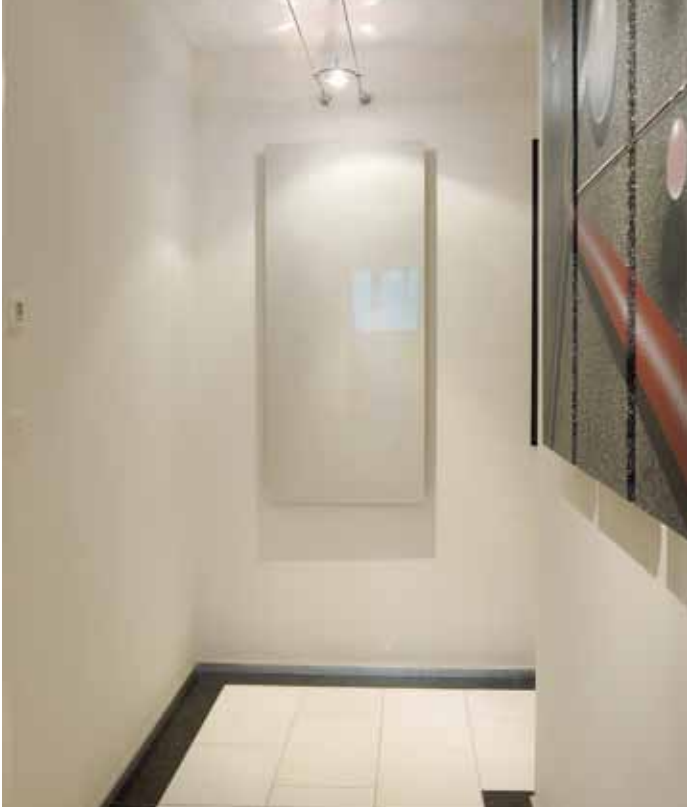
Diskreter Wärmespender: Farbe und Form können auf den Einsatzort individuell festgelegt werden.