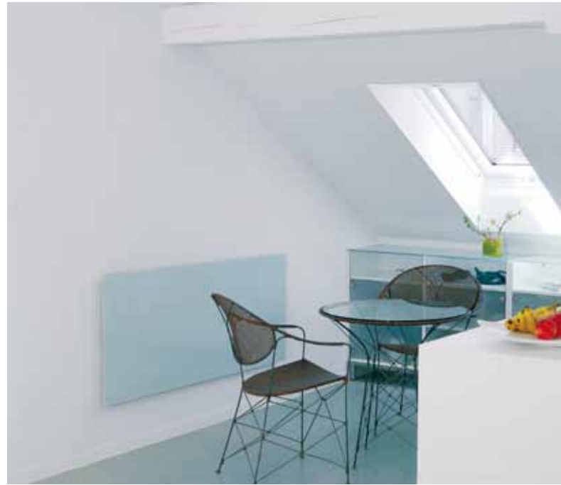
Auf die Farbgebung der umliegenden Materialien abgestimmtes Wärmeelement

die angenehme Wärme der Infra-Swiss-Heizelemente geniessen können. Unter den ausgerüsteten Gebäuden sind sowohl Neu- wie Altbauten, vom Einfamilienhaus bis hin zum Mehrfamilienhaus.“