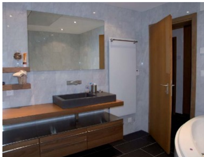
Die behagliche Wärme der Infraswiss Handtuchwärmer basiert auf Infrarot-Strahlung.

Die bei herkömmlichen Heizsystemen bedingten Verlustbringer wie Wasserleitungen, Heizkessel, Brenner, Kamine, Luftschächte und anderes mehr werden beim Heizen mit Infrarot-Wärmeelementen buchstäblich wegrationalisiert. Deshalb kann gleich mehrfach gespart werden. Neben den niedrigen Investitionskosten sind die Wärmeelemente äusserst leistungsfähig und sparsam im Betrieb und verursachen keine Reparatur- und Wartungskosten. Durch die Forschungs- und Entwicklungsarbeit der Infraswiss AG kon-