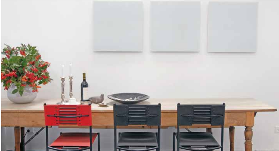
Infrarot-Paneele können als gestalterische Objekte eingesetzt werden

Im Frühling 2010 fand im «Lehrerhaus» ein Tag der offenen Tür für die Einwohner der Gemeinde Wiliberg statt. «Die Leute waren sehr interessiert und staunten über die angenehme Wärme mit dem niedrigen Verbrauch,» berichtet Baumann. «Wir sind froh, dass wir mit der neuen Heizung eine kostengünstige und für alle Parteien optimale Lösung gefunden haben.»