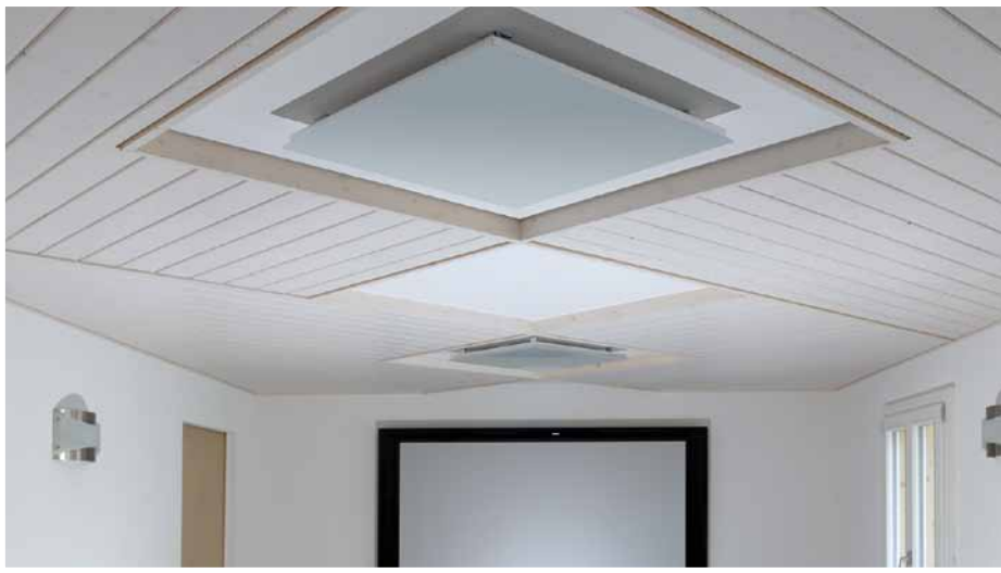
Dekorative Installation mit Täferverkleidung an der Decke

infraSWISS AG Logistikcenter 1 CH-6246 Altishofen Tel. 062 748 98 88 Fax 062 748 98 80 info@infraswiss.com www.infraswiss.com Messe Bauen & Modernisieren, Zürich Halle 5, Stand E03